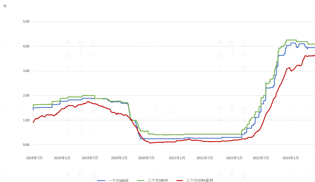
图二：一个月SIBOR、三个月SIBOR和三个月SORA复利与以往走势的比较